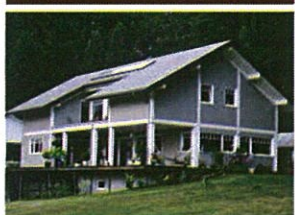
TJÆRALIN® DEKKENDE Opaque

TJÆRALIN® est un produit Norvégien breveté à base de sève de pin, d'huile de lin, de résines Alkydes et d'un agent inhibant les champignons qui fournit une propriété de surface et une bonne préservation du bois en profondeur. Très approprié pour les façades bois à la fois neuves et anciennes. Les couleurs sont stables. Tjæralin n'est pas affecté par l'humidité ni par des précipitations immédiates après l'application. Il empêche le grisonnement et la fissuration du bois. Tjæralin couvre bien et améliore l'apparence du bois naturel. Il a une haute brillance et fournit une transparence optimale. En rénovation Tjæralin peut être peint ou recouvert par lui-même sans préparation spéciale.