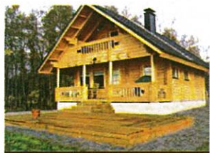
TJÆRALIN® BEIS Transparent