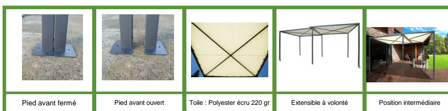
Pied avant fermé